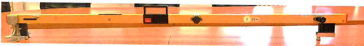
Slika 1. Izgled mjerila