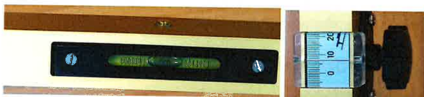
Slika 2. Uredaj za ispitivanje nadvišenja kolosijeka