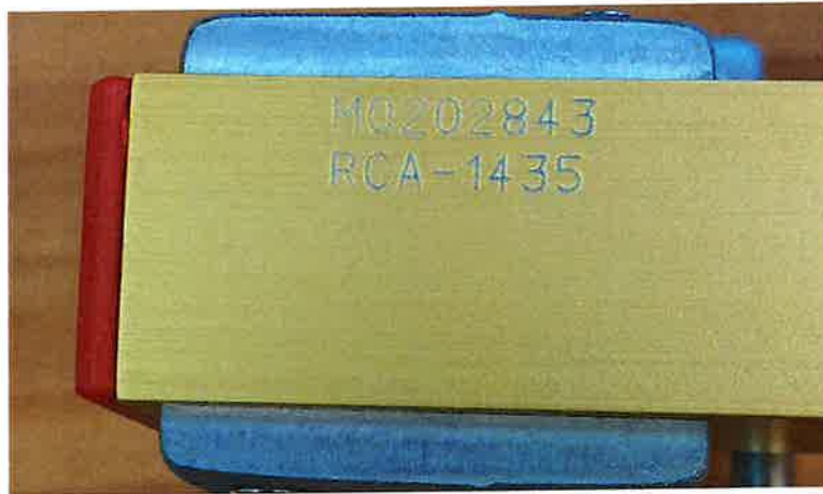
Slika 3. Serijski broj i tip mjerila

PRILOG RJEŠENJU O ODOBRENJU TIPRA MJERILA KLASA: UP/I-034-05/22-01/10 URBROJ: 558-03-01/1-22-2 PROIZVOĐAČ: Vogel & Plötscher GmbH & Co. KG, Njemačka MJERILO: mjerilo širine i nadvišenja kolosijeka RCA-1435 SLUŽBENA OZNAKA TIPRA: HR D-11-1006