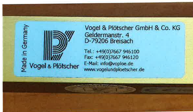
Slika 4. Oznaka proizvođača