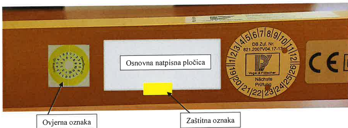
Slika 4. Mjesto postavljanja natpisne pločice i ovjerne oznake